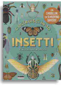
Camilla de la Bédoyère «Insetti e altri Artropodi» Fabbrì pp. 64, € 19.90 Dai 6 anni